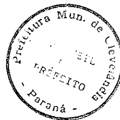
VANDERLEI VALÉRIO PREFEITO MUNICIPAL

GABINETE DO PREFEITO MUNICIPAL DE CLEVELÂNDIA, ESTADO DO PARANÁ, EM 09 DE SETEMBRO DE 2002.